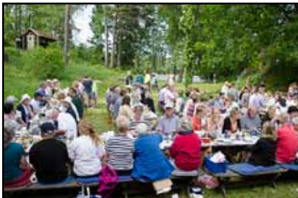
Midsommaren 2013.