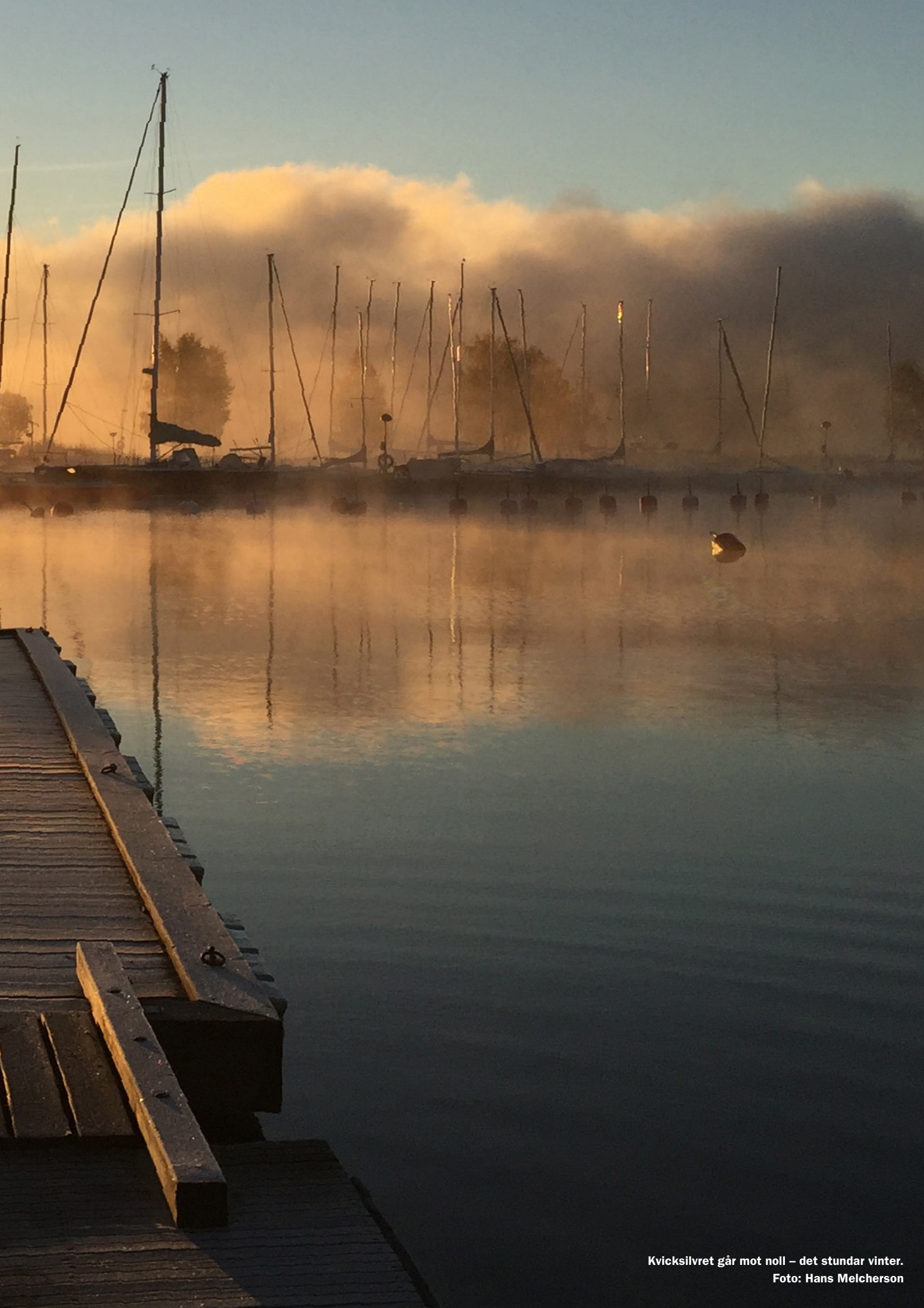
Kvicksilvret går mot noll – det stundar vinter.