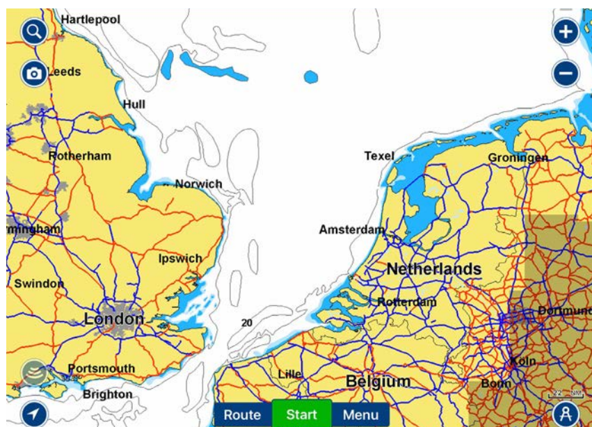
Portsmouth till Kielkanalen

Vi måste gå ut när de var högvatten vilket det var vid 9-tiden på morgonen. Nivåskillnaden är ca 4 meter och tidvattnet kommer och går ungefär var sjätte timme och då uppstår kraftiga strömmar.