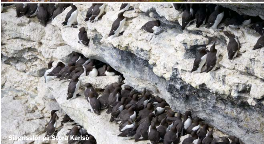
Sillgrisslor på Stora Karlsö