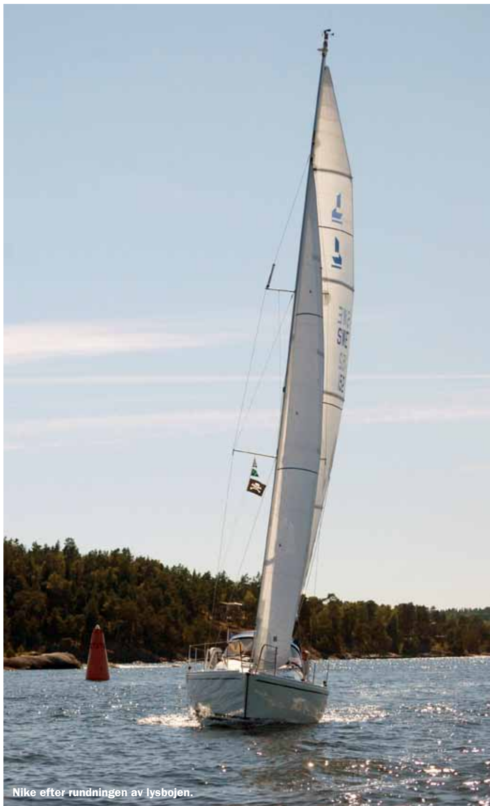
Nike efter rundningen av lysbojen.