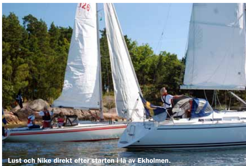
Lust och Nike direkt efter starten i lä av Ekholmen.

När alla lagt till och pysslat om sina båtar ett tag var det