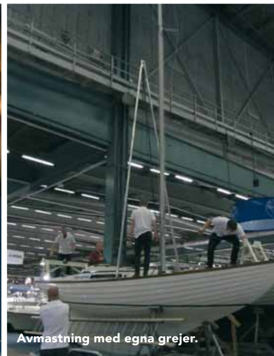
Avmastning med egna grejer.