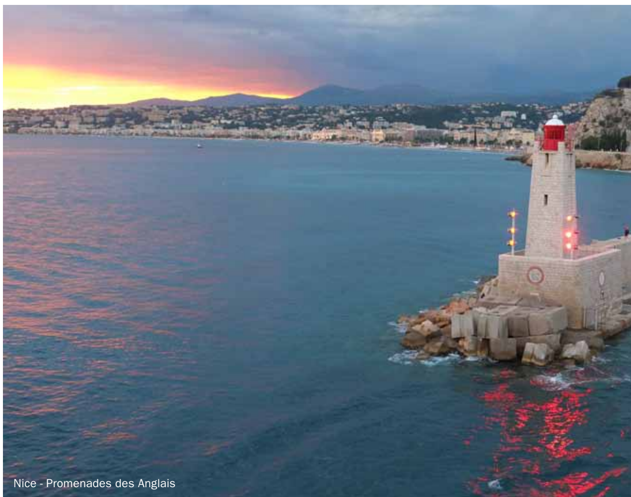
Nice - Promenades des Anglais