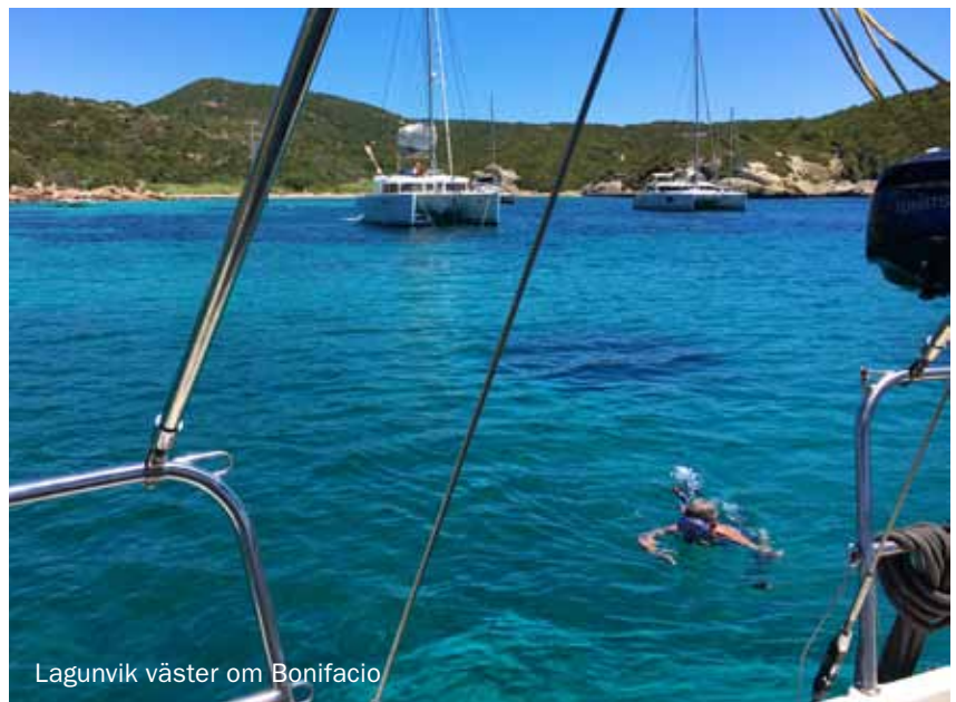
Lagunvik väster om Bonifacio

navigatör. Carat var stor och vi låg i täten och i Bonifaciosundet blåste det upp och vi drog ifrån ordentligt. Vi rundade märket på nordvästra Sardinien på natten och på vägen tillbaka mot Porto Cervo på andra sidan med spinnakern uppe i