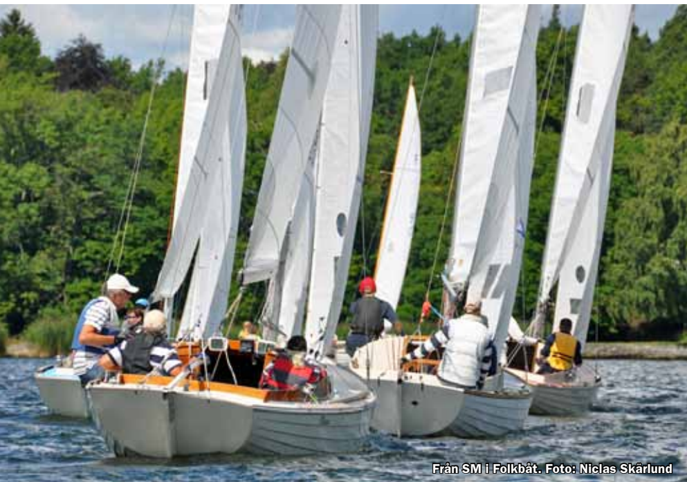
Från SM i Folkbåt.