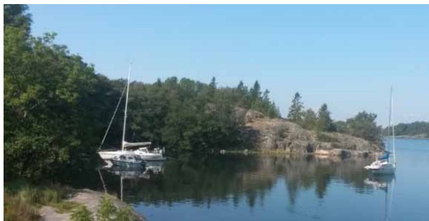
Granhamn - den klassiska utgångspunkten inför krossandet av Ålands Hav.

Dagen därpå var det dags för hemfärd för dem - och avfärd för oss. Vinden började friska i lite från