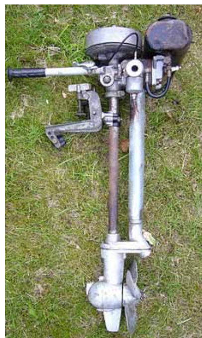
Seagull - fungerade nästan jämnt

Det smala inloppet till fladen är på mitten blockerat av en stor sten men håller man styrbordslandet kärt går man fri, när man seglar in. Vi hade också den fördelen, att bara gå en meter djupt, så om Tette skulle