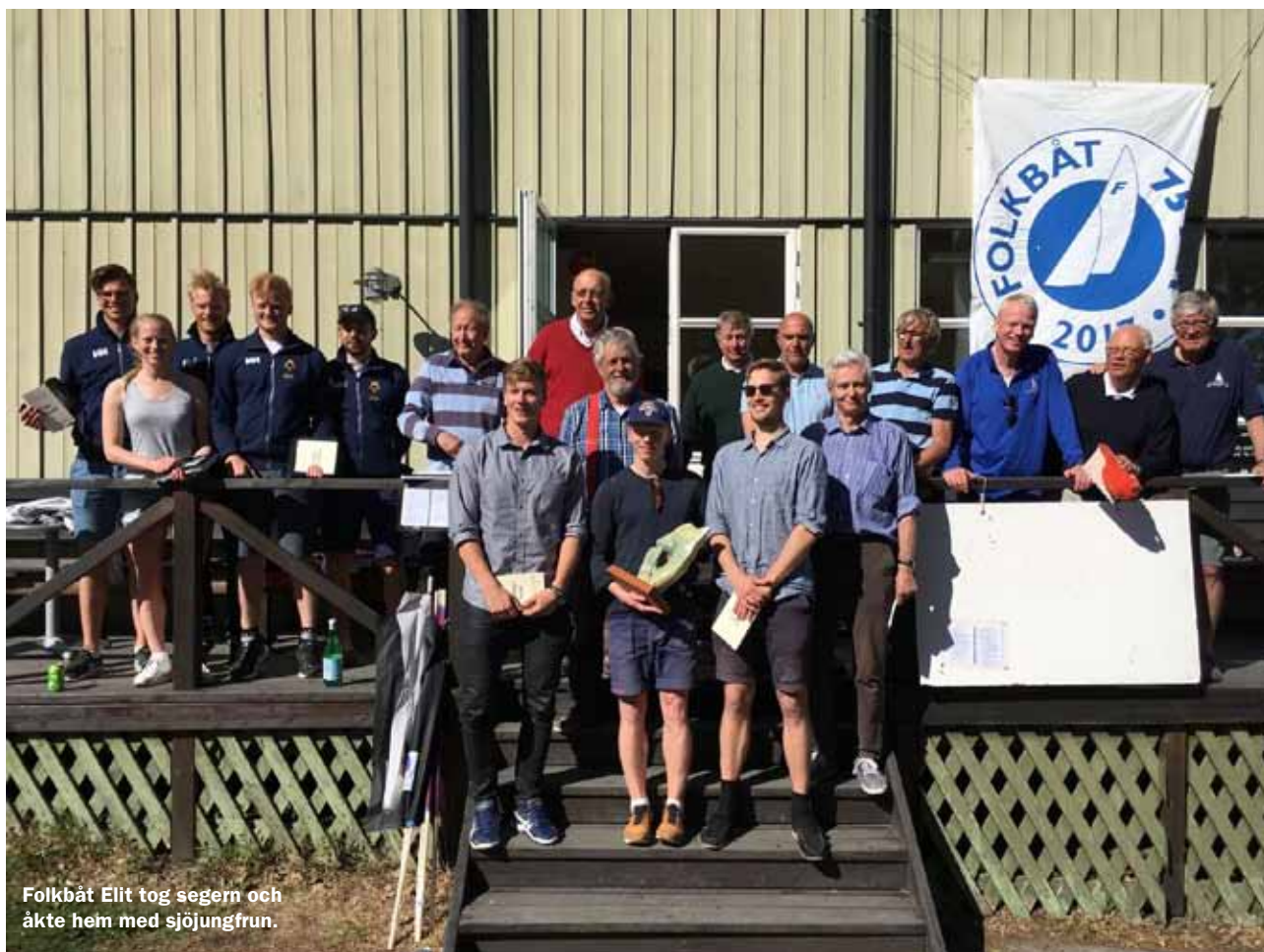
Folkbåt Elit tog segern och åkte hem med sjöjungfrun.