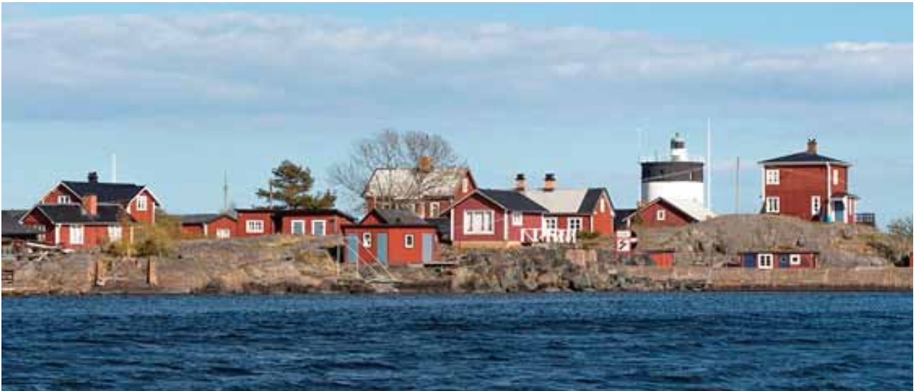
Svartklubben. Fyrplats sedan 1819 och förmodligen namngiven långt innan dylika klubbar kunde hittas i Stockholm.

med, som en trofé, när vi kom hem. Under tiden hade vinden ökat till hård sydvästlig, och det gick vita gäss på fjärden bakom oss. Folk och andra seglare som gick förbi på bryggan stannade till och frågade. Har ni kommit över Ålands hav i Den Där?