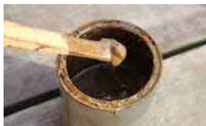
Ettan - kletigt men effektivt

Fort - inköp av tätningssmedlet Ettan - hel burk. Panikartat tätningssmedel. Ettan luktade i alla fall gott - tjära, och båten flöt trots allt fint vid sjösättningen. Påmastningen gick också utan problem. Masten en gråfläckig granpinne med en mässingsränna påskruvad utanpå. Bommen var helt i harmoni med allt det-